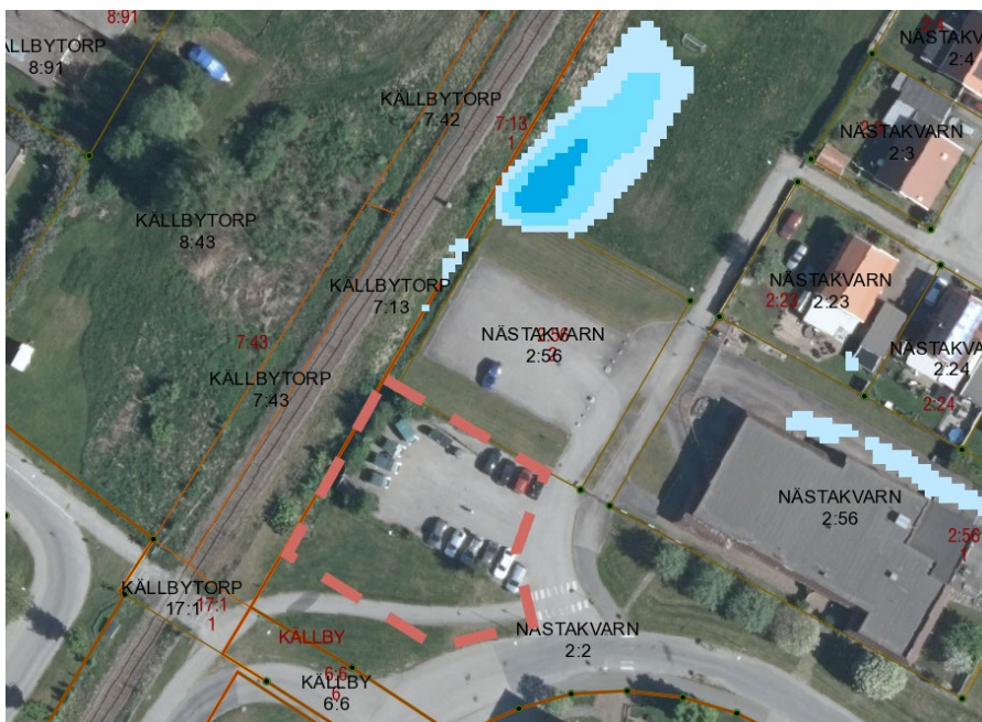
Figur 4. Området vid ett skyfall.

Under år 2023 genomförde Götene kommun en omfattande skyfallskartering för sina tätorter, med syftet att identifiera områden som är särskilt utsatta vid extrem nederbörd. Analysen visade att planområdet har god motståndskraft mot översvämningar vid ett 100-årsregn.