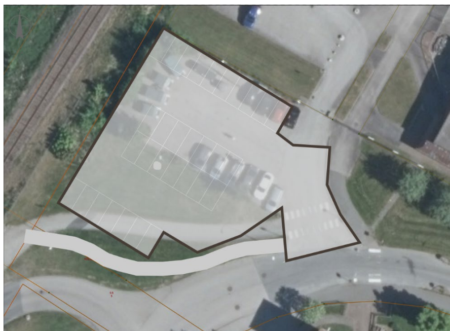
Figur 3. Illustration som redovisar hur parkeringen skulle kunna se ut efter ett genomförande.