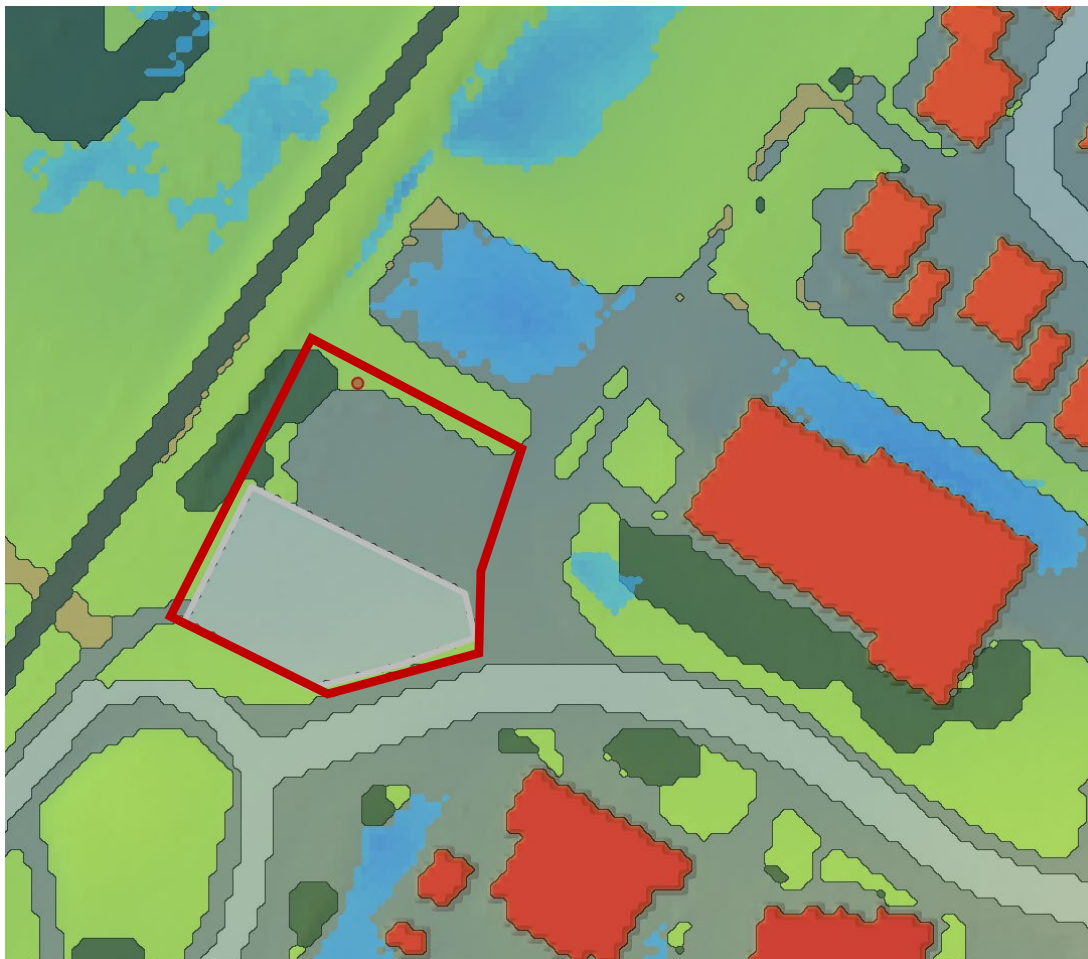
Figur 6. Illustration som redovisar hur ändringsförslaget påverkar området vid ett skyfall (100-års regn).

För undersöka planförslagets konsekvenser vid ett skyfall har Scalgo Live använts av handläggare på sektor samhällsbyggnad. Resultatet visar att vid ett genomförande av planförslaget, föreligger ingen ökad risk för översvämning av området.