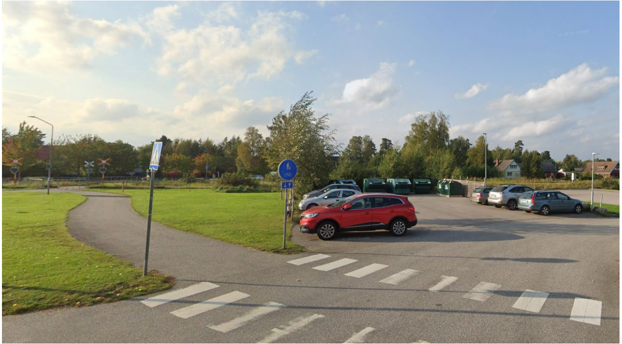
Figur 5. Foto över befintlig parkeringsplats